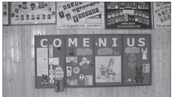
Comenius fal az iskola aulájában

dégeink olyan szép emlékekkel távoznának a hét elteltével, mint két évvel ezelőtt az előző Comenius program résztvevői.